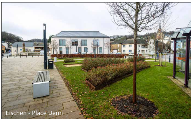
Eischen - Place Denn

Une nouvelle place publique ou espace «shared space» par commune tous les 15 ans.